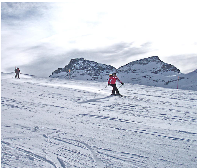
Monte Rosa, Italia