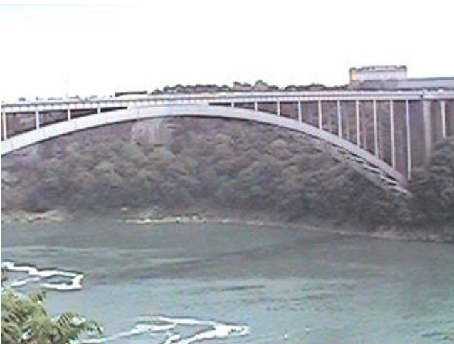
Kuvia matkalta ja matkaseurueesta