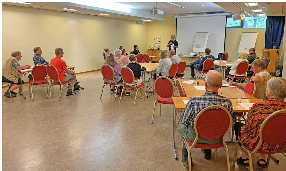
Kesäpäivien osallistujia.