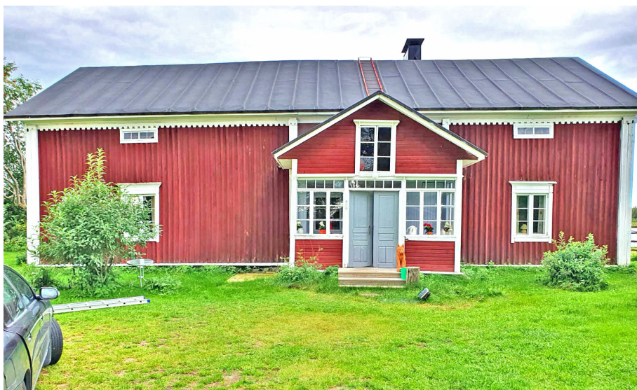
Sepän Talo, Yli-Ii