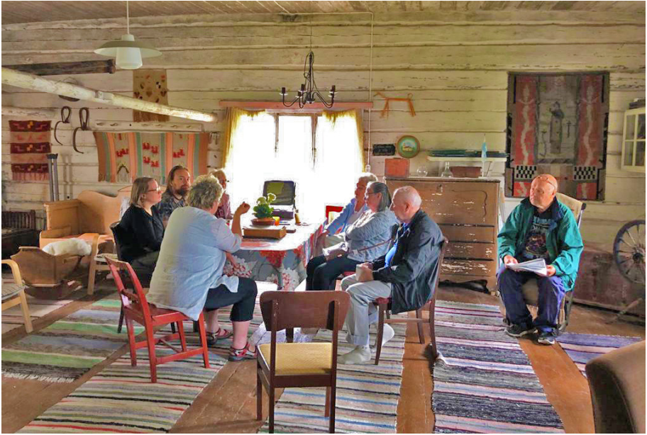
Kuva edellisen artikkelin Iijoen tapaamisesta 21.–23.8.2020.