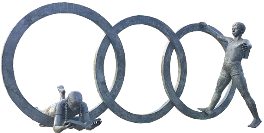
Taideteos Barcelonassa (Espanja).