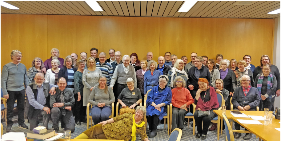
Ryhmäkuva talvipäiville 2020 osallistujista