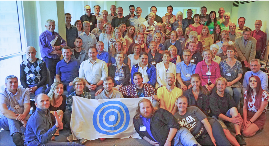
Ryhmäkuva Tallinnan konferenssin osallistujista 13.7.2019