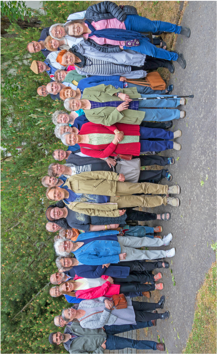
Urantia-kirjan lukijoiden kesätapaaminen 2018 Hauholla.