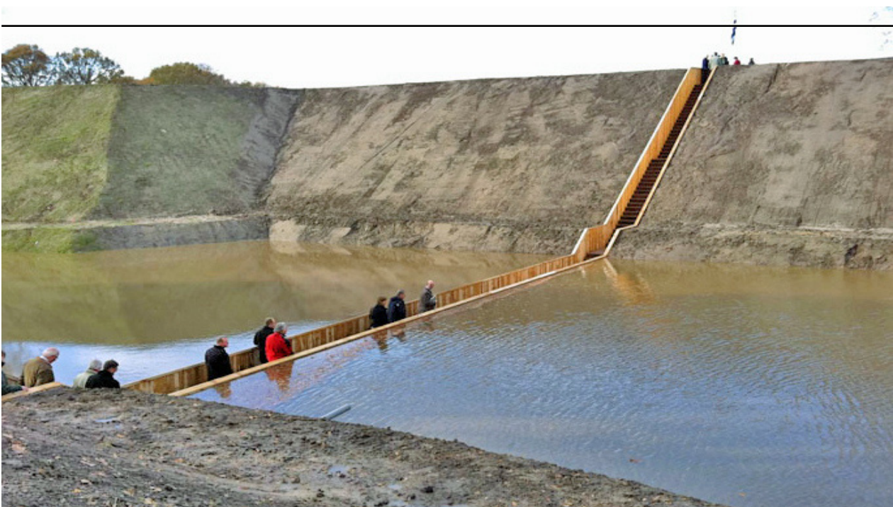
Mooses-silta, Alankomaat. Kuvituskuvia