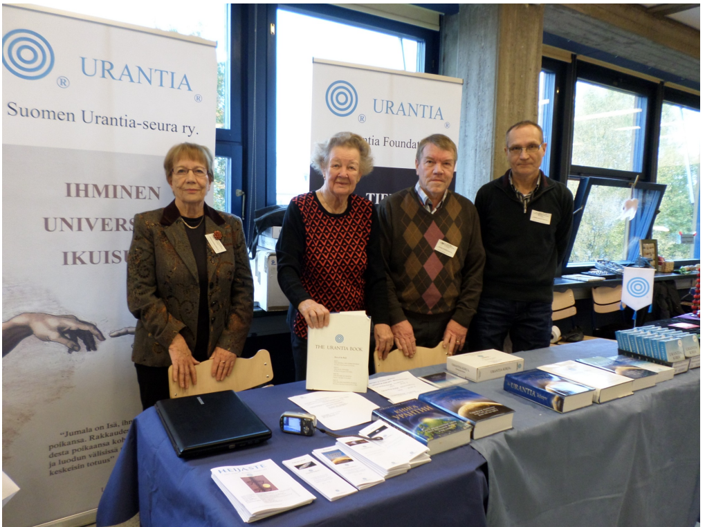
Kuva Helsingissä pidetyiltä Hengen ja tiedon messuilta 11.-12.10.2014