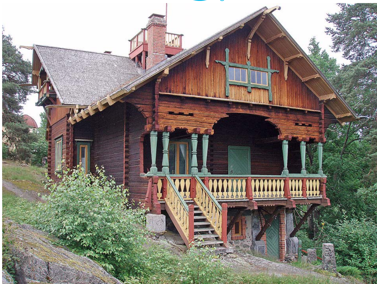
Eräs Emil Wikström museotaloista Visavuorella