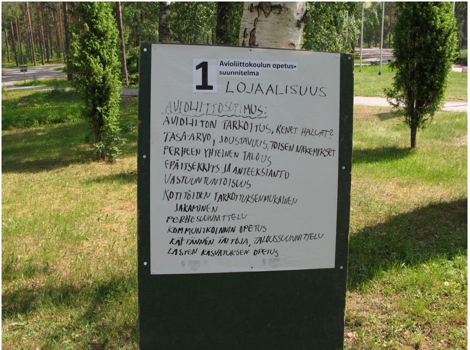
ryhmätyön tuloksia