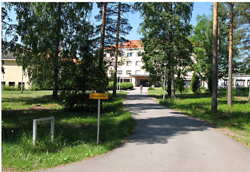
Kesäpäivät: Kiljavan opisto, Kiljavanranta