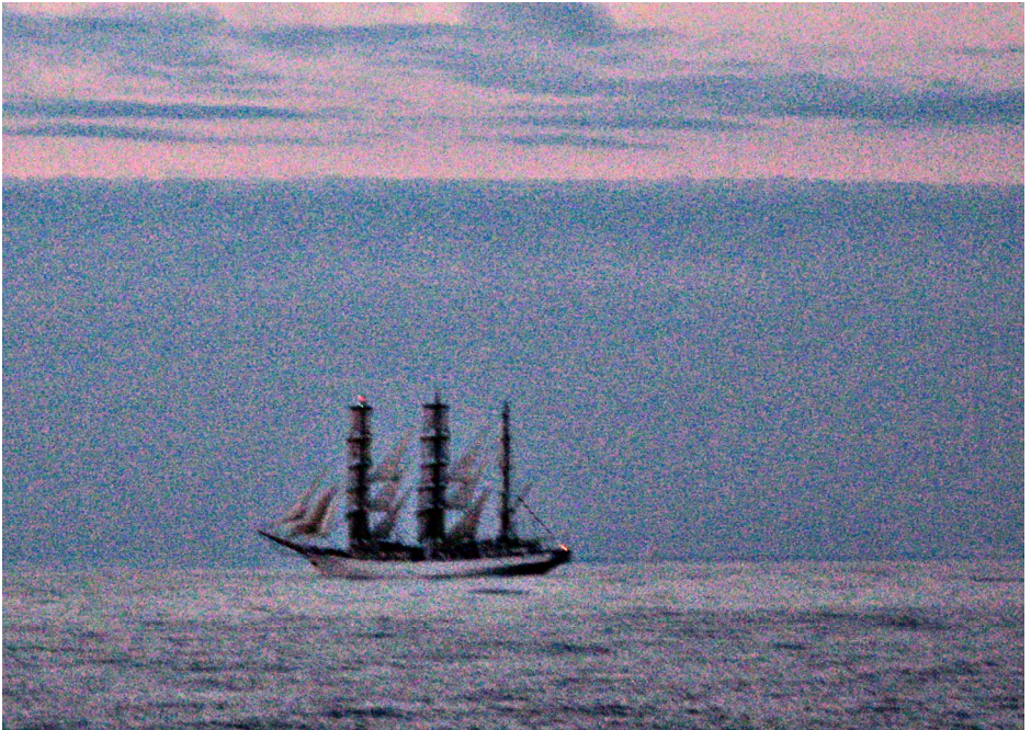
Suomenlahdella 13.7.2007 klo 04