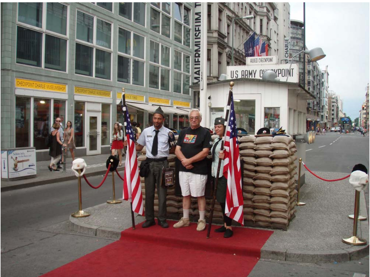
(Checkpoint Charlie Berliinissä)