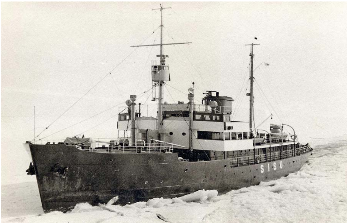
(Jäänmurtaja SISU Suomenlahdella)