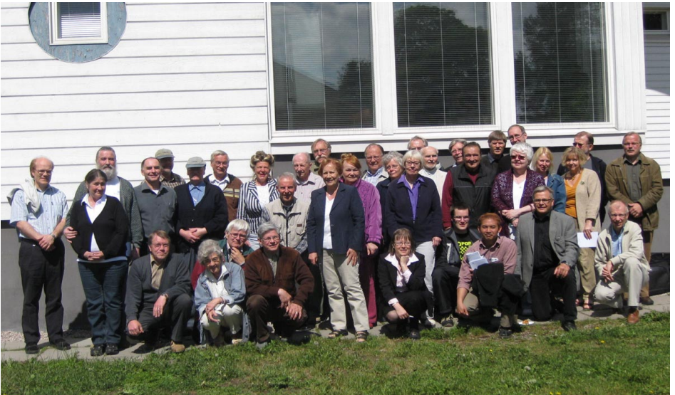
Kesäpäivien 2009 osallistujia Espoon Kaisankodissa.